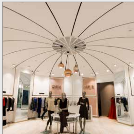
مجتمع تجاری ارگ - تهران